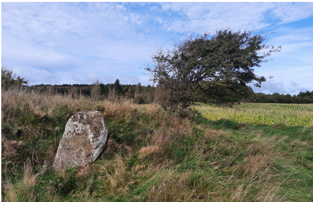
Parti fra langdyssen set mod Friplejehjemmet. Motivet har været inspiration til logoet for Støtteforeningen.